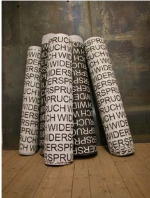
Gertrude Moser-Wagner EIN METER WIDERSPRUCH Mitarbeit: Isabel Czerwenka-Wenkstetten